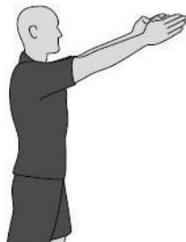
יתרון לאחר עבירה