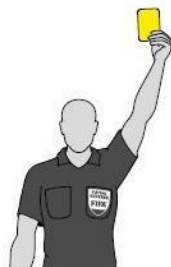
אזהרה - כרטיס צהוב