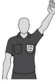
בעיטה חופשית בלתי ישירה